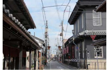
黒壁スクエア(長浜市)