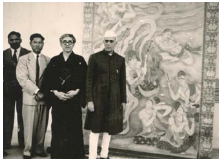
「平和」をネルー首相に贈呈する杉本哲郎